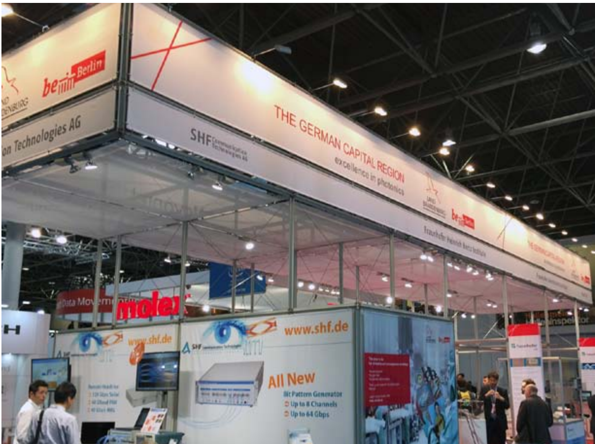
Oben: Neues Standkonzept MWC 2017, Barcelona