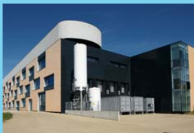
Fraunhofer-Institut für Biomedizinische Technik (IBMT) in Potsdam-Golm