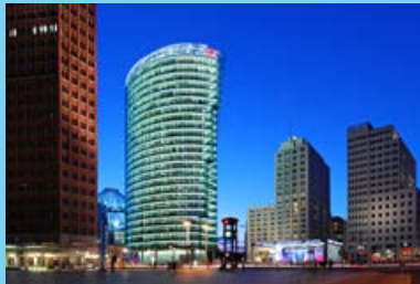
Potsdamer Platz in Berlin