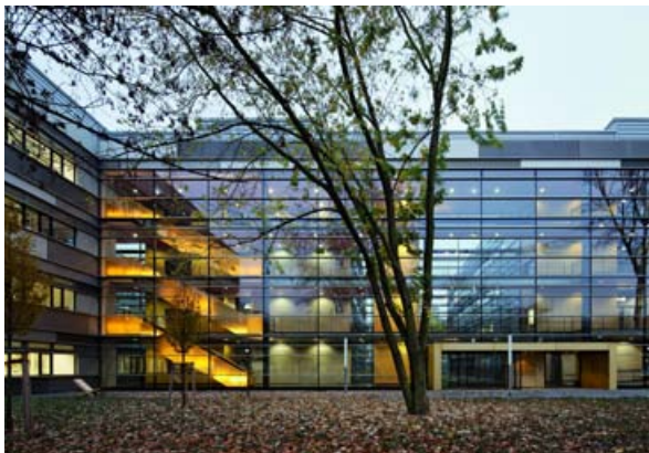
Zentrum für Mikrosysteme und Materialien (ZMM) in Berlin-Adlershof

Zehn Hochschulen und 26 außeruniversitäre Einrichtungen forschen in der Region auf dem Gebiet der Optischen Technologien und der Mikrosystemtechnik. Rund 2.200 Wissenschaftler arbeiten in den Einrichtungen, mehr als 40 Studienangebote dienen der Ausbildung von qualifiziertem Nachwuchs. Zur Forschungslandschaft gehören Institute mit Weltgeltung wie das Max-Born-Institut, das Helmholtz-Zentrum Berlin oder das Fraunhofer-Institut für Zuverlässigkeit und Mikrointegration. Die Verbindungen in die Wirtschaft sind traditionell eng und sehr gut, was viele Kooperationen und gemeinsame Entwicklungsprojekte demonstrieren.