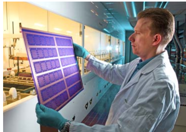
Substratlinie zur fertigungsnahen Forschung am Fraunhofer IZM in Berlin-Wedding